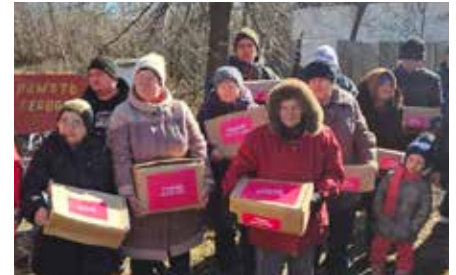
Los cristianos ucranianos que viven en las ruinas de su aldea bombardeada, cerca de la primera línea de guerra, reciben alimentos. La ayuda se distribuyó rápidamente debido al peligro constante de nuevos bombardeos.

“Estamos muy agradecidos”, agregó nuestro socio de la iglesia. “Ustedes vienen a nosotros y nos ayudan mucho con artículos tan necesarios como estufas, leña, alimentos y ayuda sanitaria. Gracias por todo.”