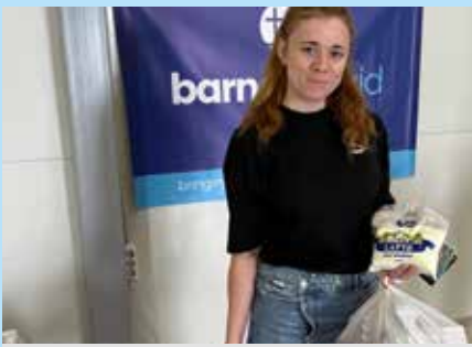
Irina y su hija soportaron meses de bombardeos.