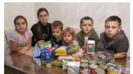
Otros niños cristianos ucranianos con suministros muy necesarios entregados a través de food.gives.