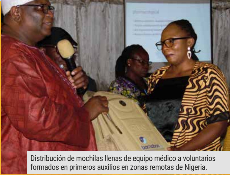
Distribución de mochilas llenas de equipo médico a voluntarios formados en primeros auxilios en zonas remotas de Nigeria.

$59 podría proporcionar una máquina de moler maíz para una viuda cristiana en Nigeria.