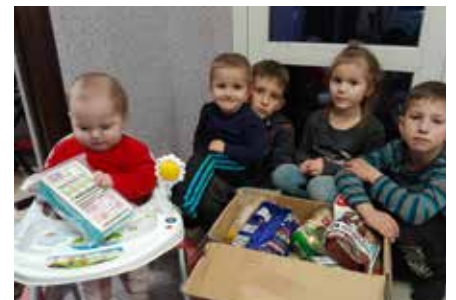
Unos niños cristianos ucranianos inspeccionan la caja de comida entregada a su familia.