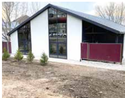
La iglesia recién reparada en Kazajistán.

La mayoría de la congregación son cristianos de primera generación, una mezcla de conversos del islam y antiguos ateos. El aumento de la conciencia de la identidad nacional ha resultado en un aumento de la hostilidad hacia los cristianos, y la iglesia lleva a cabo actividades para fortalecer a los miembros frente a la persecución.