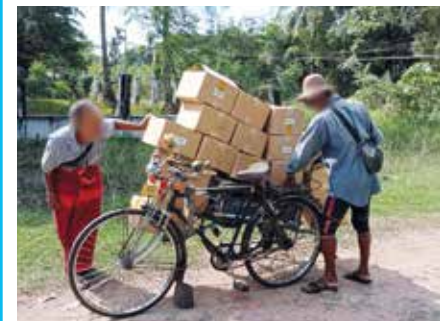
Biblias entregadas en bicicleta a los cristianos de Karen en Myanmar.

En el momento de redactar este artículo la distribución del primer envío de 50,000 Biblias está ya en marcha y la entrega de otras 44,000 está a punto de comenzar. Oren para que la distribución total de 200,000 se complete de manera segura.