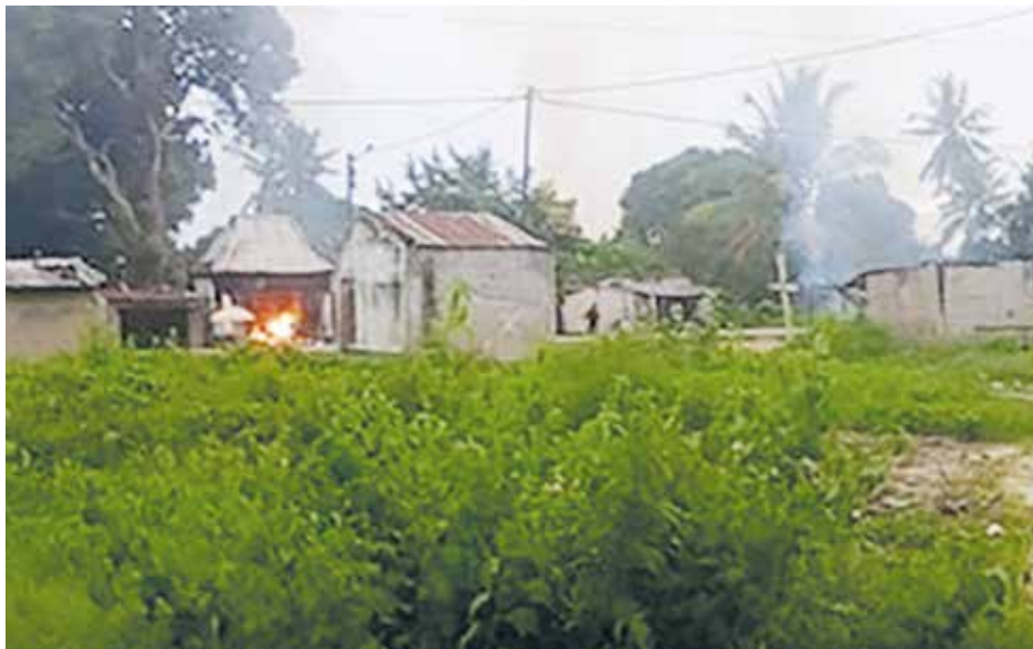
Las llamas envuelven las casas en la aldea de Ntotoe, distrito de Mocimboa da Praia.

Alrededor de 1,800 cristianos han sido asesinados en el norte de Mozambique desde octubre de 2017 en un contexto de violencia contra los cristianos. Los musulmanes moderados también son atacados y asesinados.