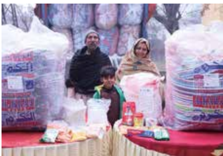
Una de las 172 familias cristianas que recibieron comida y ropa de cama cálida de Bernabé.

“Toda la alabanza a nuestro Dios, que se preocupa por nosotros y nos envía ayuda a través de Bernabé”, dijo un receptor de los bienes de invierno. En la fase I proporcionamos alimentos, kits de higiene y artículos para el hogar.